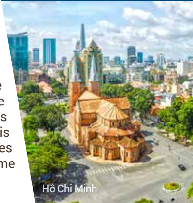
Hô Chi Minh

Spirituelle et montagneuse, entourée de plages de sable blanc, Bali est célèbre pour sa beauté, son énergie et sa créativité. Les croisières à Bali sont une merveilleuse introduction à cette île enchantée. Avec sa riche culture hindoue et ses traditions profondes, associées à une scène culinaire passionnante, Benoa est la porte d'entrée vers les plages, les forêts tropicales, les rizières émeraude et les 10 000 temples de l'île. Visitez la plage populaire de Tanjung Benoa, explorez Ubud, puis assistez à une authentique danse du feu Kecak avant de mettre le cap sur certaines des destinations les plus emblématiques d'Asie. Toutes les visites seront incluses durant notre séjour à Bali. Le programme sera sur une formule détente et découvertes.