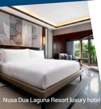
Nusa Dua Laguna Resort luxury hotel

Petit-déjeuner à l'hôtel. Ce matin, vous ferez la visite du sanctuaire Meiji-jingu. Le sanctuaire Meiji est un grand sanctuaire shinto situé dans le quartier Yoyogi de Tokyo, un peu au sud-ouest de l'immense quartier commerçant qu'est Shinjuku. Cette belle retraite