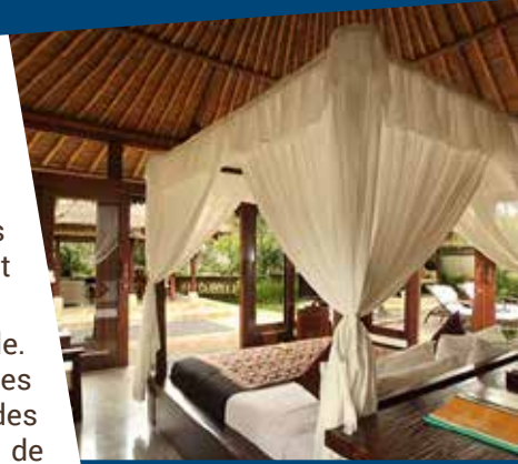
UBUD VILLAGE RESORT AND SPA 5

Le complexe The Ubud Village Resort & Spa vous accueille au cœur des rizières du village de Pengosekan. Situé à 10 minutes à pied de la forêt des singes, il propose des villas dotées d'une piscine privée, d'un étang peuplé de poissons et d'une connexion Wi-Fi gratuite (sujet à changement sans préavis). Nichées dans un jardin privé, les villas et les suites de l'Ubud Village Resort & Spa disposent d'une kitchenette et d'une terrasse dotée d'une banquette-lit. Chaque salle de bain est pourvue d'une douche intérieure et extérieure, ainsi que d'une baignoire au sol. Pendant votre séjour, vous pourrez vous baigner dans la piscine extérieure principale et réserver un massage relaxant au spa ($). L'Ubud Village Resort met en outre à votre disposition une salle de sport, un centre d'affaires et un service de conciergerie. Le restaurant Angkul-Angkul sert des spécialités locales, dans un pavillon de 2 étages entouré de jardins et de rizières. Le café The Paddy prépare quant à lui des collations et des boissons chaudes.