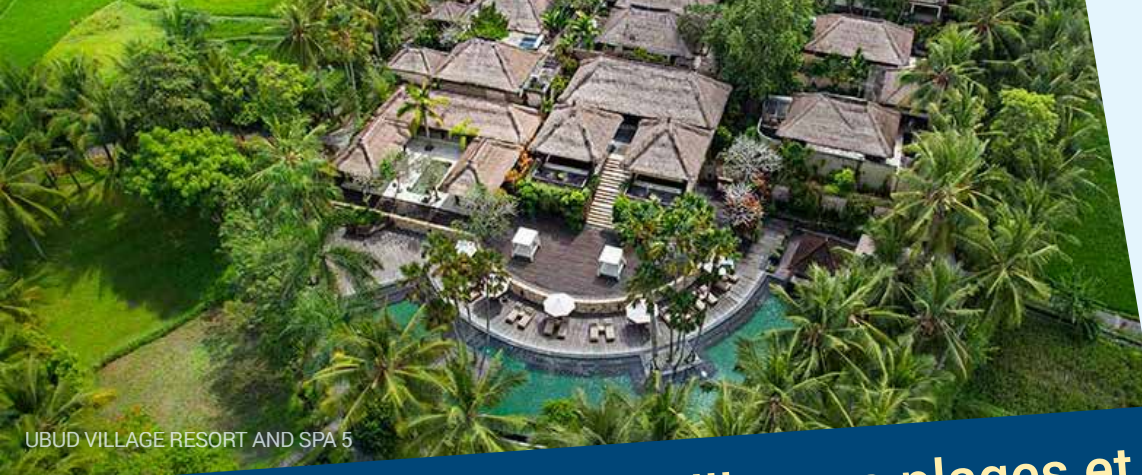
UBUD VILLAGE RESORT AND SPA 5