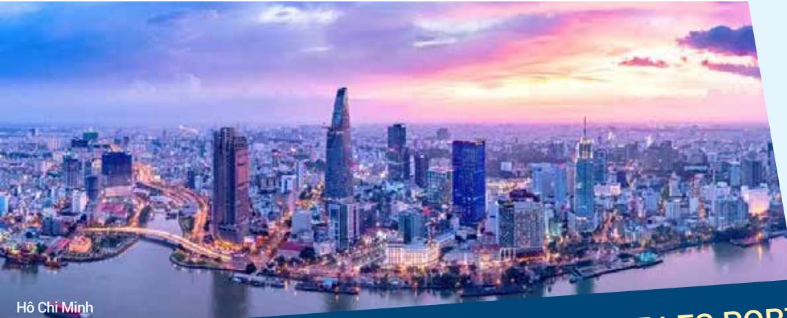
Hô Chi Minh