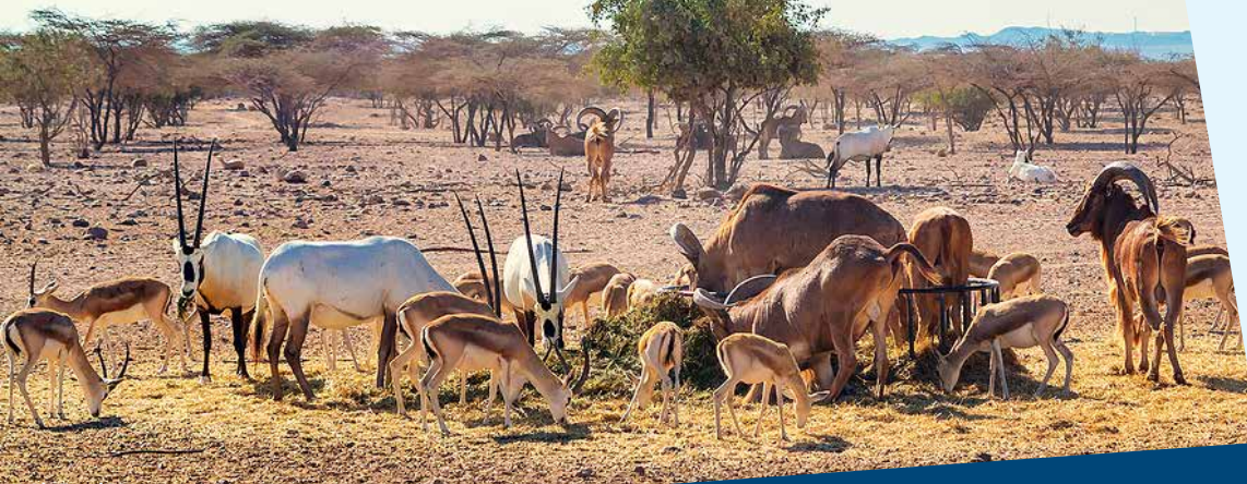
Sir Beni Yas