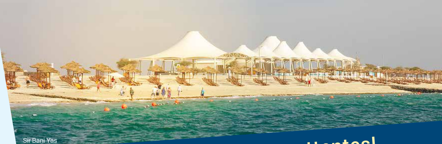
Sir Bani Yas