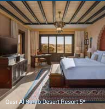
Casr Al Sarab Desert Resort 5*