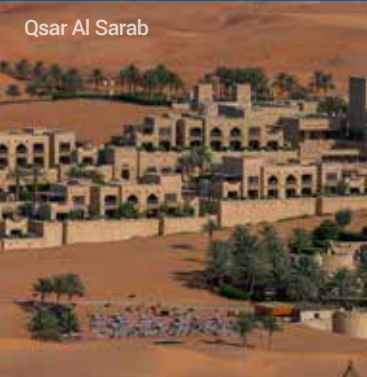
Qsar Al Sarab