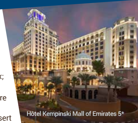
Hôtel Kempinski Mall of Emirates 5*