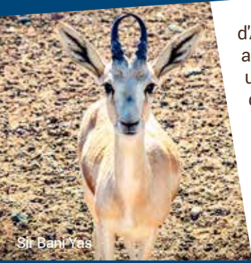
Sir Bani Yas