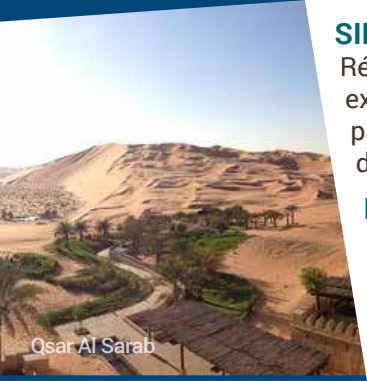
Qsar Al Sarab