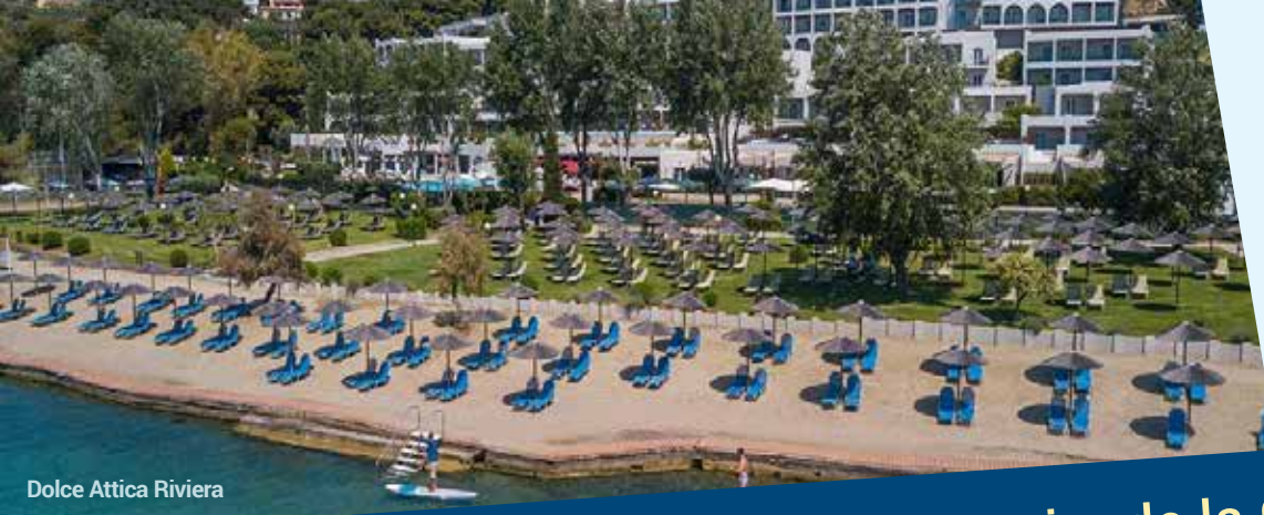
Dolce Attica Riviera