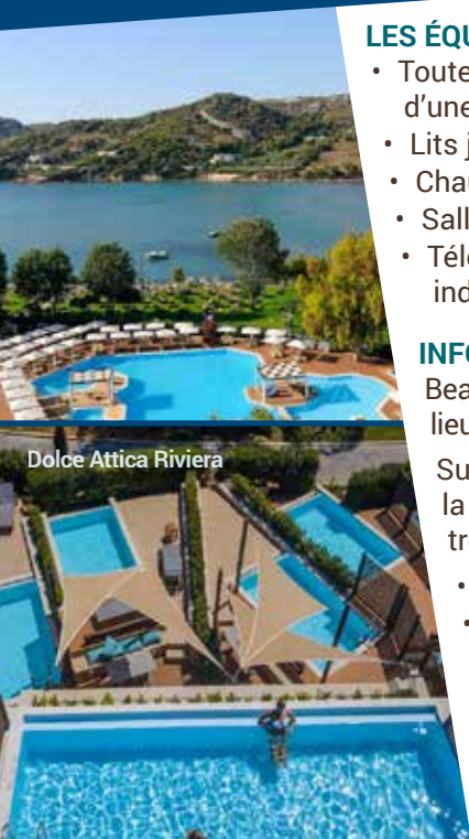
Dolce Attica Riviera