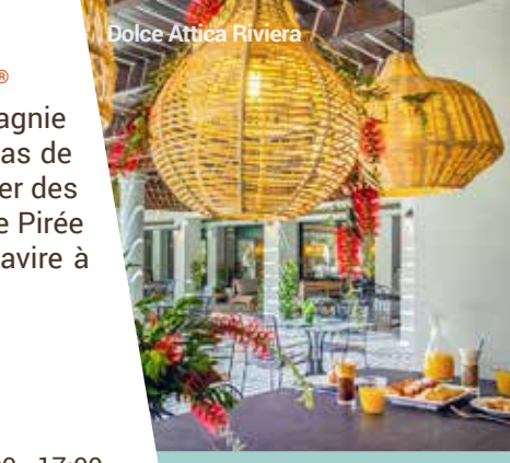
Dolce Attica Riviera