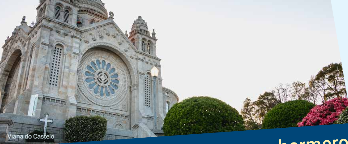
Viana do Castelo