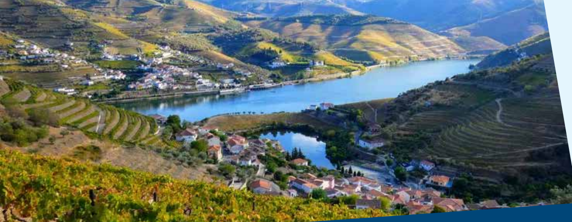
Senhora da Ribeira