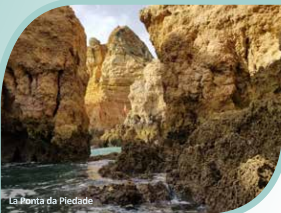
La Ponta da Piedade

*Veuillez prendre note que les kilométrages par jour sont donnés à titre indicatif seulement. Les itinéraires journaliers, pour le bien fondé du programme, pourraient être modifiés sans aucun autre avis.