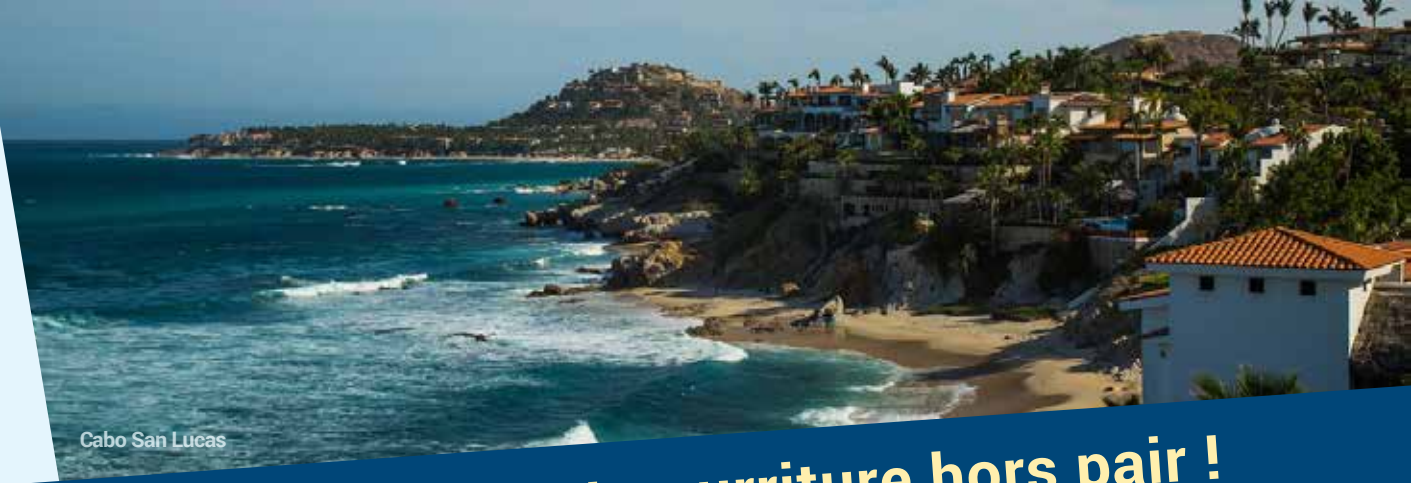
Cabo San Lucas