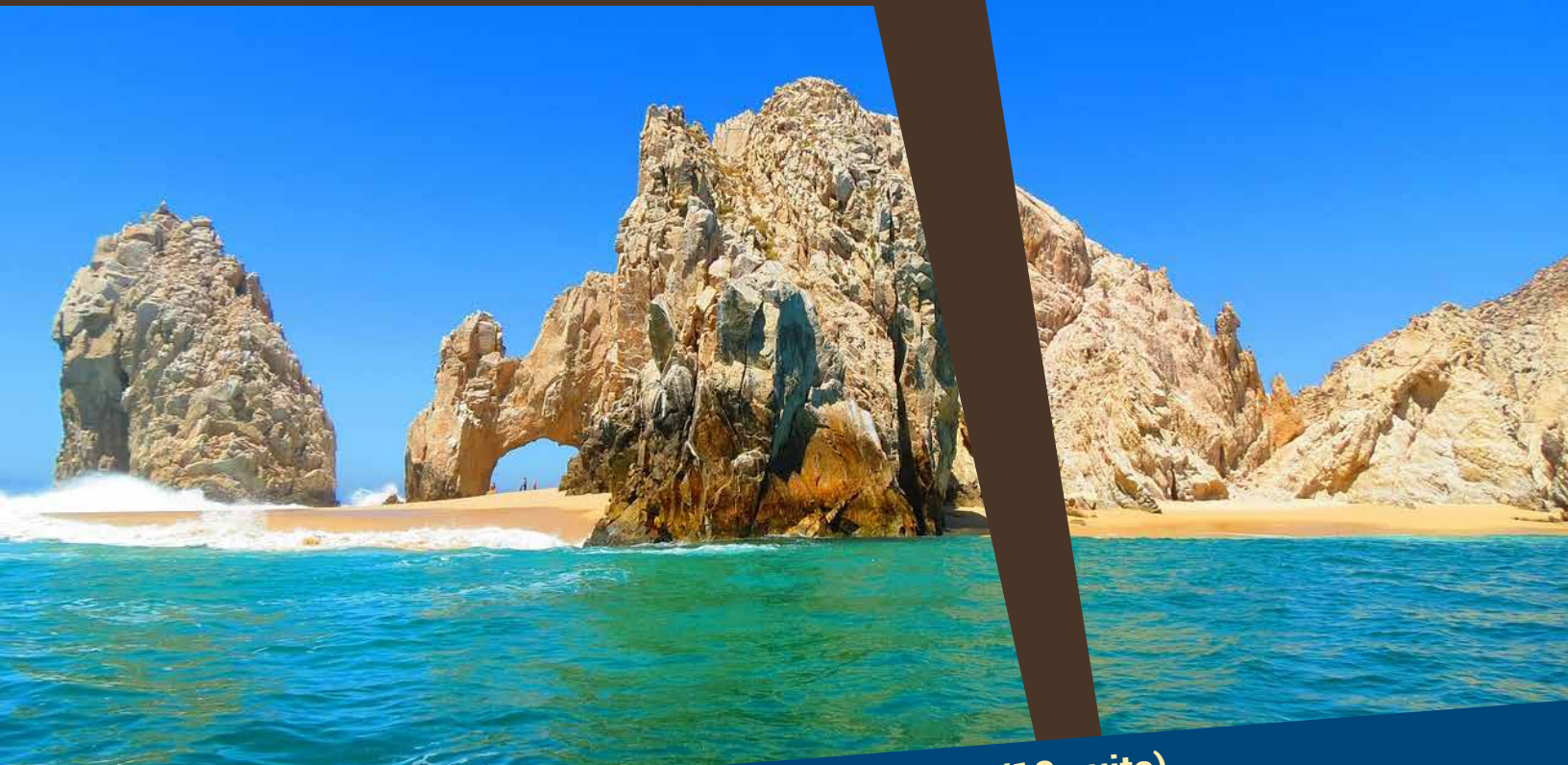
Cabo San Lucas