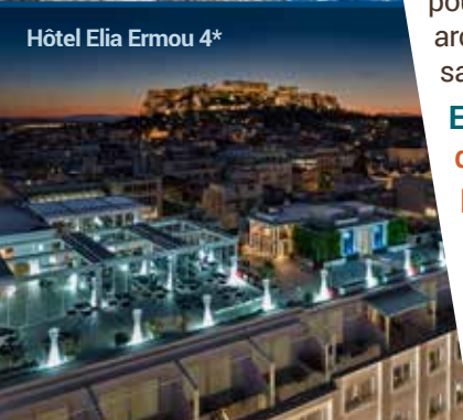
Hôtel Elia Ermou 4*

Accueil au port par votre guide francophone. Vous ferez un tour de ville panoramique pour suivre les pas de Saint Paul. Cette visite vous permettra de découvrir les lieux historiques associés à la vie et aux voyages de Saint Paul à travers les sites clés de son itinéraire. Visite panoramique d'une demi-journée, sans lunch.