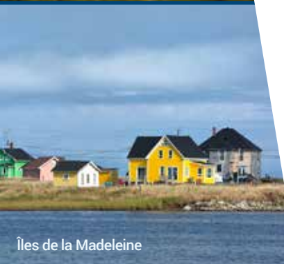
Îles de la Madeleine