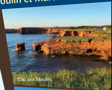
Cap aux Meules