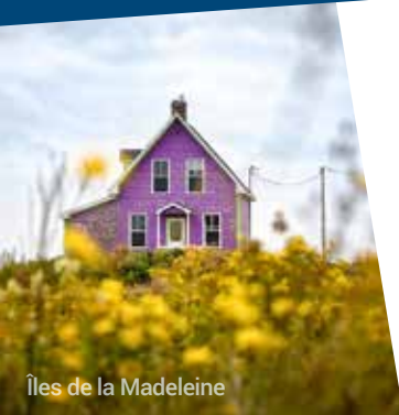
Îles de la Madeleine

L'Île-du-Prince-Édouard – ou « l'île », comme on l'appelle souvent – est sur la côte est du Canada, bercée par le golfe du Saint-Laurent. Elle fait partie des quatre provinces de l'Atlantique, avec le Nouveau-Brunswick, la Nouvelle-Écosse et Terre-Neuve-et-Labrador. Charlottetown, la capitale de la province, est à environ 1 600 km de Toronto, 1 000 km de Montréal, 1 100 km de Boston et 1 450 km de la ville de New York. C'est aussi une ville côtière dynamique, malgré sa petite taille, Charlottetown ne manque ni d'énergie ni d'hospitalité. La capitale côtière est remplie d'histoire, de culture, de festivals, d'activités, d'artisanat et de restaurants de calibre mondial. Alors qu'attendez-vous? Partez à la découverte de Charlottetown! Charlottetown est la capitale de l'Île-du-Prince-Édouard, au Canada. Elle est située sur la côte sud de la province. C'est à Province House, lieu historique national, que s'est tenue en 1864 la Conférence de Charlottetown, qui a conduit à la naissance du pays. Le centre commercial Victoria Row