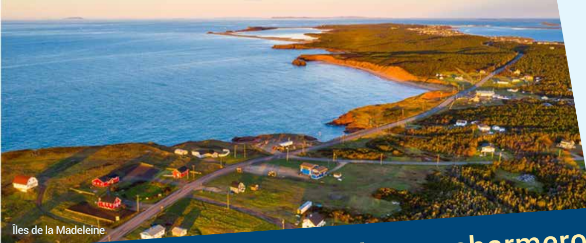
Îles de la Madeleine