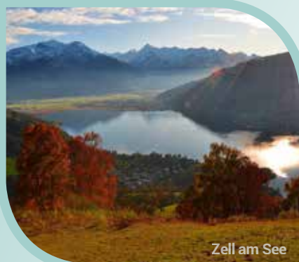
Zell am See