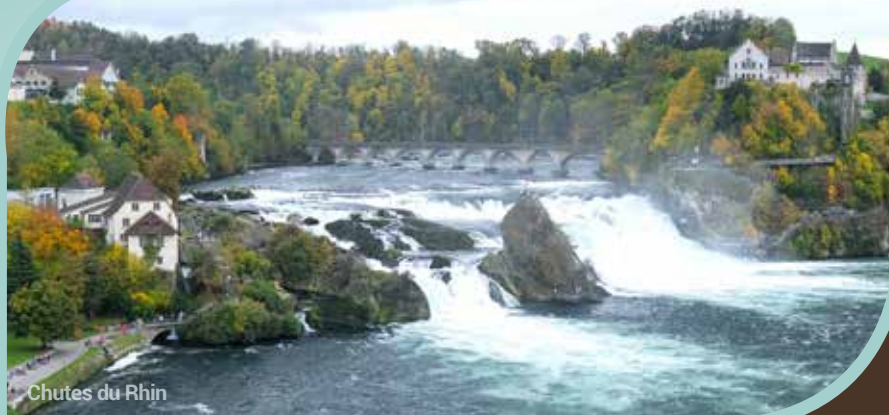
Chutes du Rhin