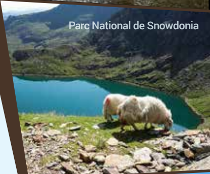
Parc National de Snowdonia