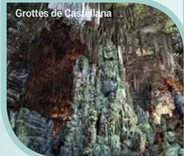
Grottes de Castellana

Petit-déjeuner à l'hôtel. Départ pour la visite de l'antique Pompéi, cette ville romaine située au pied du volcan Vésuve et qui fut enfouie sous les cendres volcaniques. C'est un tremblement de terre qui fut le prélude à l'éruption du volcan, survenue en l'an 79 après J.-C., et qui détruisit la ville de Pompei, tout en donnant la mort à ses nombreux habitants. C'est en parcourant les rues que vous pourrez reconstituer l'histoire de cette époque par la multitude des vestiges que vous y découvrirez. Bien qu'aujourd'hui, Pompéi soit très fréquentée par le tourisme, il n'en reste pas moins que vous serez touchés par le travail des historiens et des archéologues qui ont su redonner une tout autre vie à cette ville. Puis, vous visiterez un atelier d'artisanat de camées et de corail, une autre spécialité de la baie de Naples, inspirée des anciennes traditions gréco-romaines. Dîner et retour à l'hôtel pour le souper. (PD/D/S)