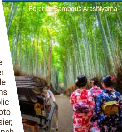
Forêt de Bambous Arashiyama