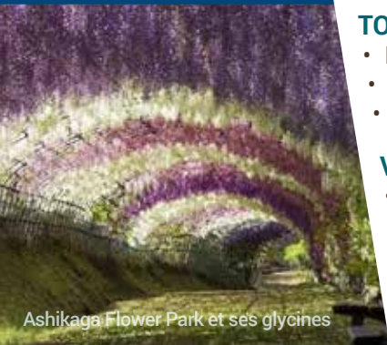
Ashikaga Flower Park et ses glycines