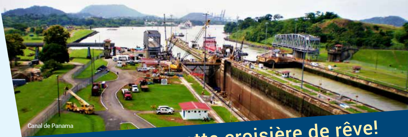
Canal de Panama