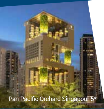
Pan Pacific Orchard Singapour 5*

Toutes les excursions pendant la croisière sont incluses et seront guidées en français!