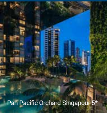
Pan Pacific Orchard Singapour 5*