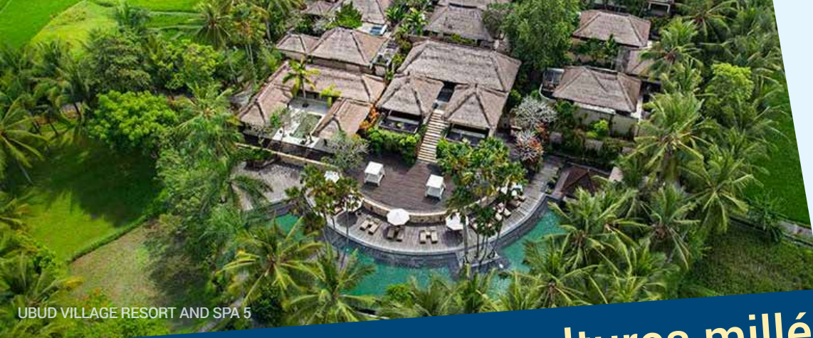
UBUD VILLAGE RESORT AND SPA 5