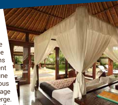
UBUD VILLAGE RESORT AND SPA 5

Vol vers Denpasar (Bali) à 1 h 50 pour une arrivée à Bali à 16 h 30. Accueil par notre guide local francophone qui nous