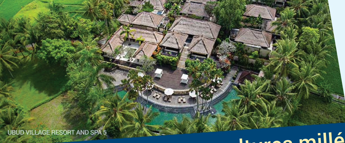
UBUD VILLAGE RESORT AND SPA 5