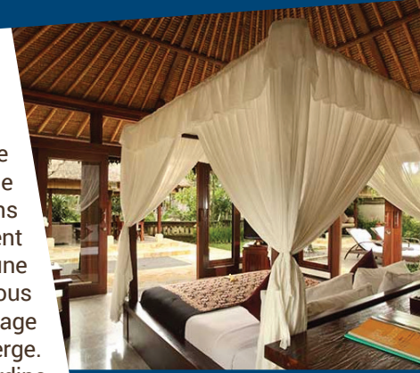
UBUD VILLAGE RESORT AND SPA 5

Vol vers Denpasar (Bali) à 1 h 50 pour une arrivée à Bali à 16 h 30. Accueil par notre guide local francophone qui nous