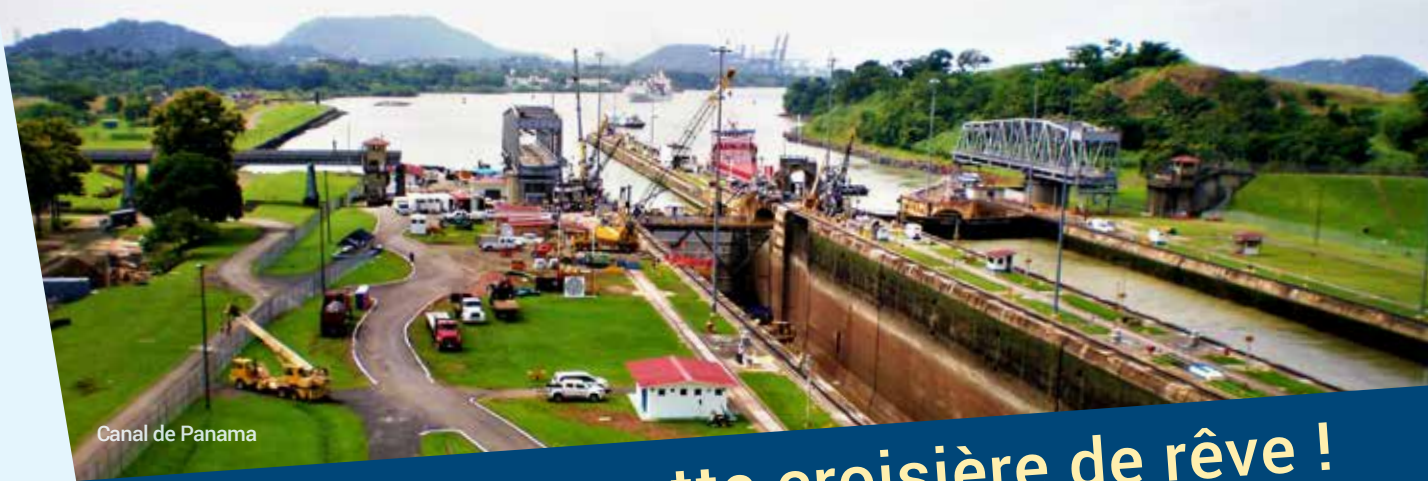
Canal de Panama