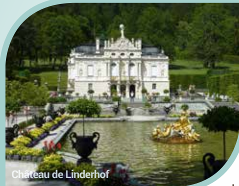
Château de Linderhof