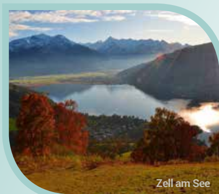
Zell am See