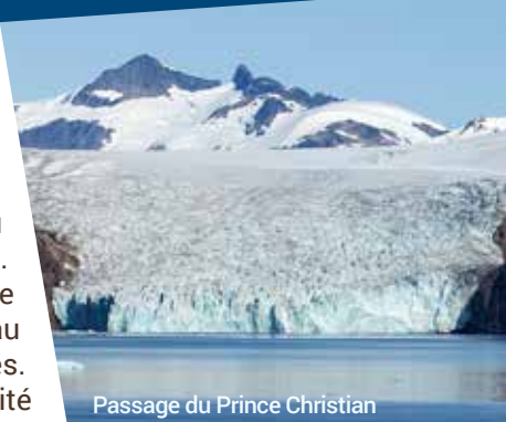
Passage du Prince Christian

Partez à la découverte d'un des trésors des Fjords de l'Ouest avec cette excursion vers les chutes de Dynjandi au départ d'Ísafjörður. Cette visite authentique d'une des parties les plus reculées d'Islande est l'occasion parfaite de faire une incursion dans les terres lors d'une escale à Ísafjörður. Les Fjords de l'Ouest sont à la fois la région la moins visitée d'Islande, mais aussi la plus impressionnante. Isolée derrière plusieurs chaînes de montagne, ces territoires sont les plus vieux d'Islande et regorgent de sites incroyables : entre vallées verdoyantes et collines anciennes, de nombreuses cascades, dont Dynjandi, traversent votre circuit. C'est à Ísafjörður que vous rencontrerez votre guide local et que vous monterez à bord d'un Super Jeep, véhicule créé sur mesure pour les terrains accidentés d'Islande. La majorité des routes sont inaccessibles une bonne partie de l'année dans les Fjords de l'Ouest. Ce type de véhicule est donc indispensable pour découvrir les perles cachées de cette région. À Ísafjörður, vous emprunterez le tunnel