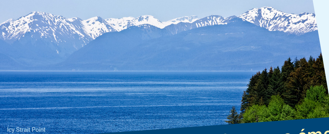
Icy Strait Point