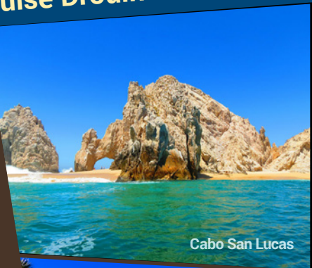
Cabo San Lucas

Imaginez la traversée du mythique canal de Panama, à bord de notre splendide navire, le Celebrity Millennium, pour deux semaines de plaisir assuré. Le départ de la Californie nous permettra de visiter San Diego, où nous passerons une nuit. Nos magnifiques ports d'escale sont à Cartagena, en Colombie, à Colón, pour la découverte de la ville de Panama City, au Costa Rica, au Guatemala et dans plusieurs belles villes mexicaines. Autant d'escales riches en découvertes, en patrimoine historique et en paysages fascinants qui vous attendent avant d'atteindre la côte de la Floride jusqu'à Fort Lauderdale. Le canal de Panama est un canal important traversant l'isthme de Panama en Amérique centrale, reliant l'océan Pacifique et l'océan Atlantique. Sa construction constitue l'un des projets d'ingénierie les plus difficiles jamais entrepris. Son impact sur le commerce maritime a été considérable, puisque les navires n'ont plus eu besoin de faire route par le Cap Horn. Il s'étend sur 80 km entre la capitale Panama City, sur la côte Pacifique et Colón, sur l'Atlantique. Plus de 12 000 bateaux l'empruntent chaque année. Les énormes bateaux, qui naviguent dans cette voie d'eau étroite encadrée de chaque côté par la forêt vierge, créent un spectacle inoubliable.