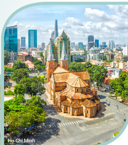
Ho Chi Minh