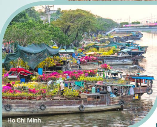
Ho Chi Minh

Petit-déjeuner à l'hôtel. Départ pour Tay Ninh , siège de la religion caodaïste, mélange local de bouddhisme, taoïsme, catholicisme et d'islam. Visite du temple principal lors de la prière de midi et promenade dans les espaces sacrés. Dîner dans un restaurant local. Retour à Ho Chi Minh Ville avec l'arrêt à Cu Chi , l'un des lieux les plus surprenants de l'histoire de la guerre du Vietnam. Visite des tunnels de Cu Chi , véritable ville souterraine composée de réseaux de plus de 250 km de tunnels où le Viet Cong menait sa guerre de résistance contre les troupes américaines. Visite également d'une laquerie . Souper de groupe. Nuit à l'hôtel. (PD/D/S)